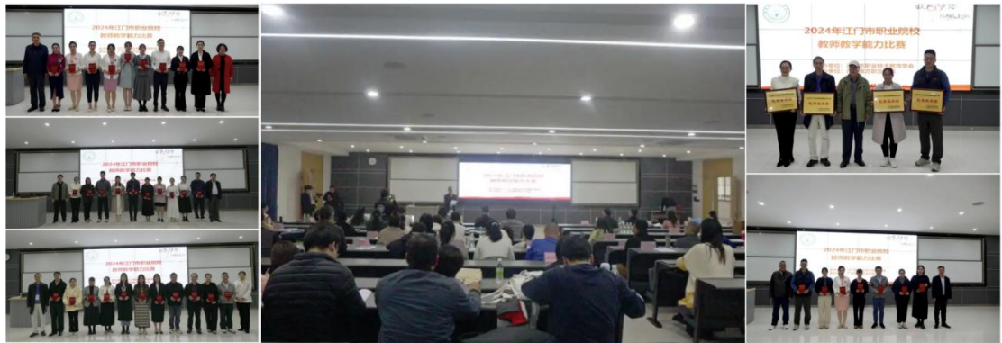
图6 2024年职业院校教师教学能力比赛