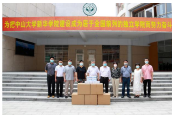
图11 广东南方职业学院为中山大学新华学院捐赠口罩等防疫物资

成效辐射显著，凸显协同育人价值。近年来，成果发表核心期刊论文12篇，3项教学成果获省级奖项、获得教学质量管理与评价改革优秀案例二等奖1项、三等奖1项，优秀奖1项，《广东省课程思政示范课程》等项目获批立项。与广州粤嵌科技有限公司、江门空创格科