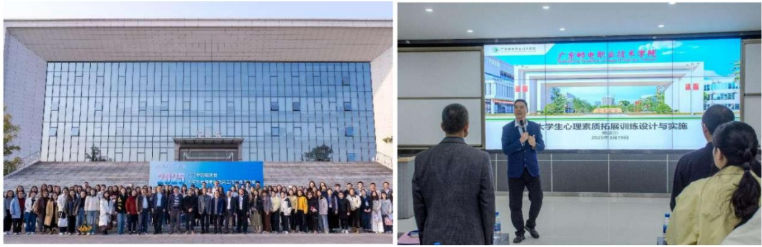
图5 举办高职院校心理健康教育工作交流研讨会