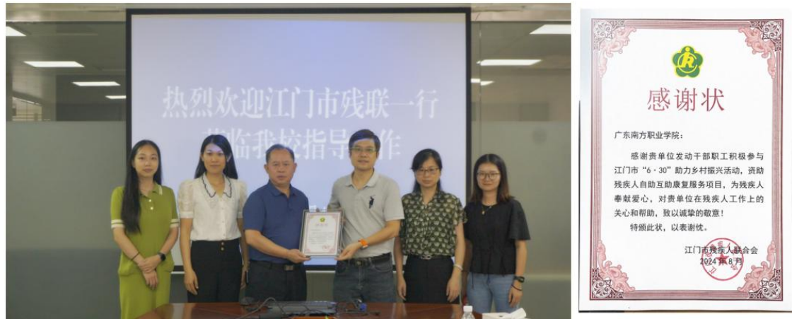
图7 江门市“6·30”助力乡村振兴活动感谢状

赋能基层队伍建设，助力区域振兴。 2024年至2025年，广东南方职业学院先后为阳春市教育系统开展工会干部与教师培训120余人次，助力基层教育队伍思想政治素质与专业能力的双提升。同时，面向江门市退役军人适应性培训、初中校长任职资格培训等项目累计培训2356人，有效实现了“技能提升”与“价值引领”的深度融合，获得地方政府的高度评价。