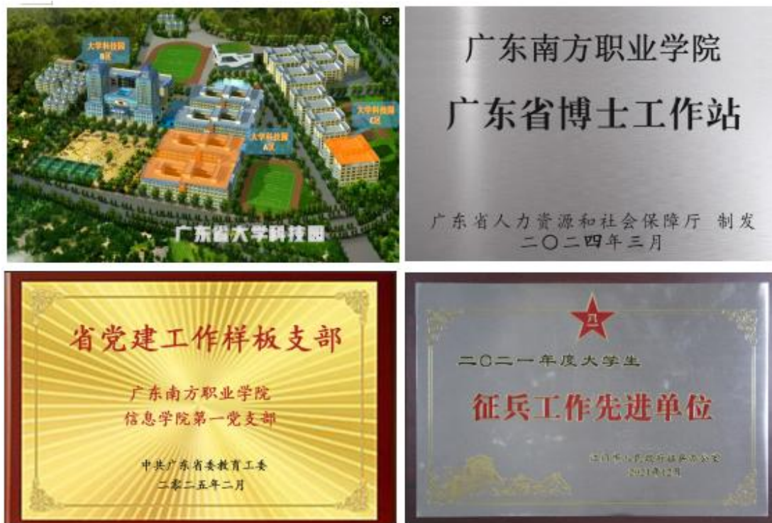
图4 学校荣获多项国家级、省级工作荣誉