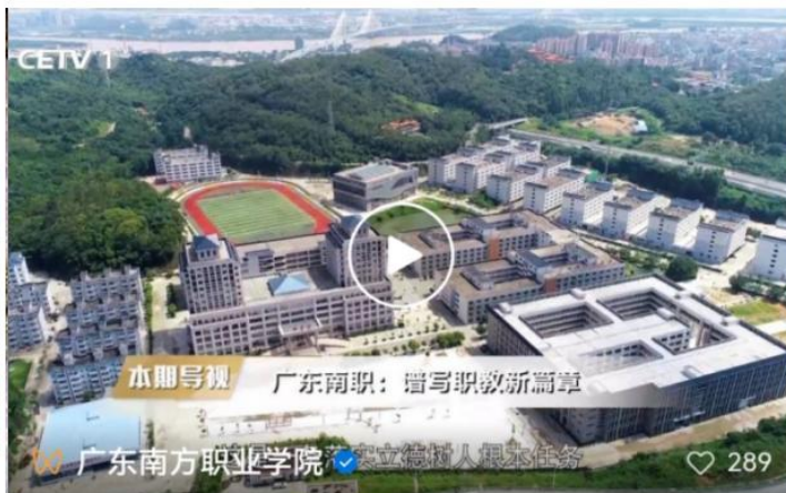
图9 新华网、中国教育电视台系列报道