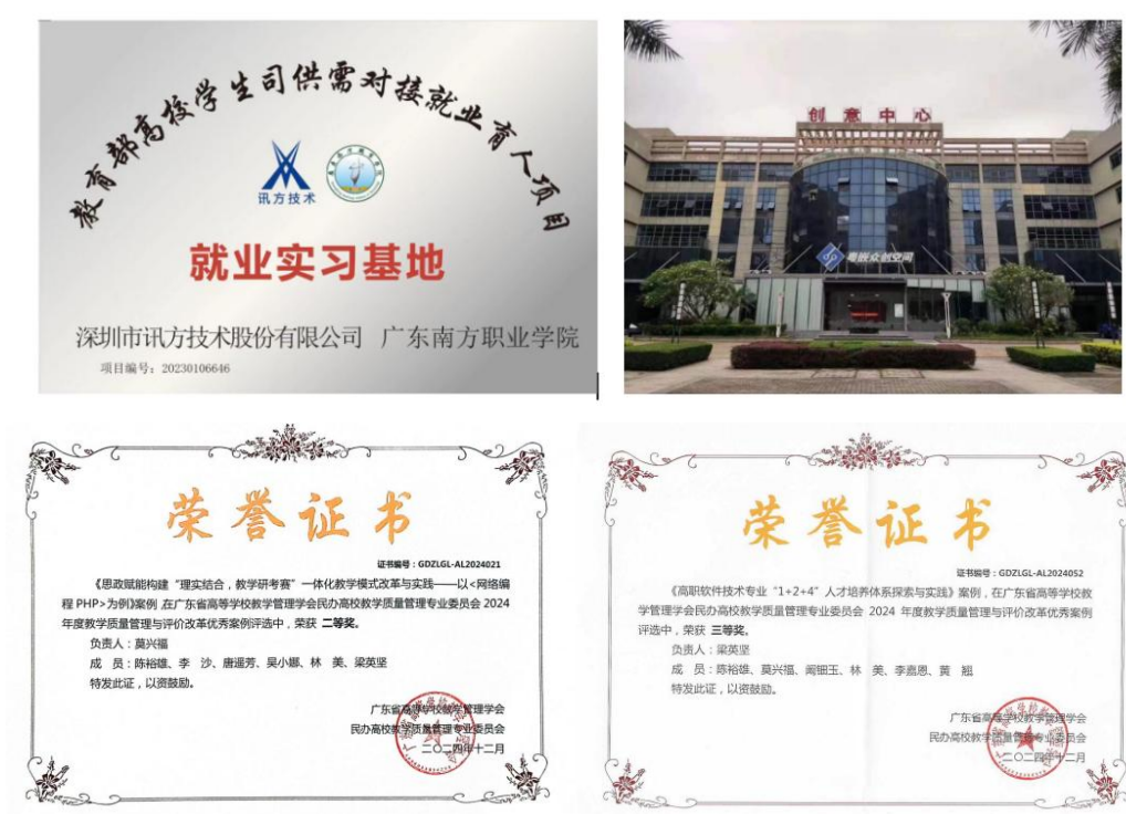
图12 实习基地、成果奖项

技术有限公司等共建产学研平台20多家，联合开展真实项目教学80余项，学生参与率达85%以上。23家企业与学校建立长期合作机制，共建实习实训基地20多个，带动区域科技创新与产业升级。