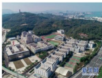
广东南方职业学院。