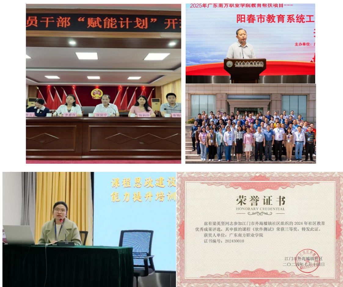
图8 系列赋能培训活动