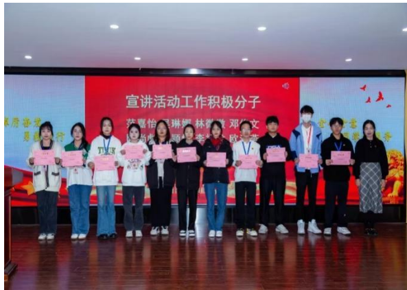
图 5:讲习团积极分子颁奖