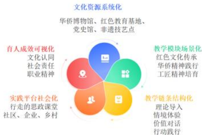
图2:地方文化嵌入式五环协同育人模型

动中凝聚共识，在志愿行动中落实于行。依托“行走的思政课堂”机制，将课堂延伸到社区、企业与乡村一线，学生担任“红色讲解员”“华侨文化宣讲员”“乡村研学小讲师”，在真实社会情境中传播理论、服务基层，厚植文化自信与家国情怀，增强学生对中国特色社会主义的政治认同、思想认同、情感认同。