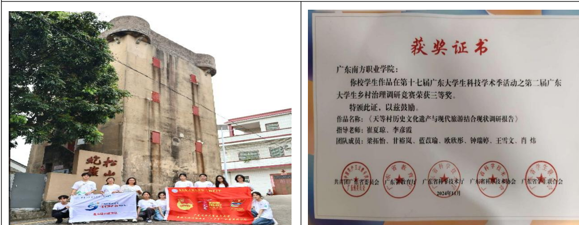
图 13：爱国教育基地调研拍摄