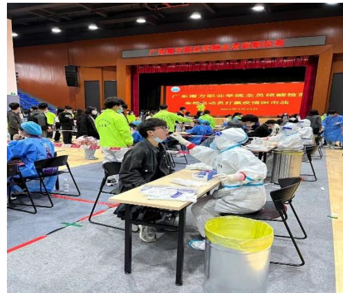
图 6:学生担任抗疫志愿者