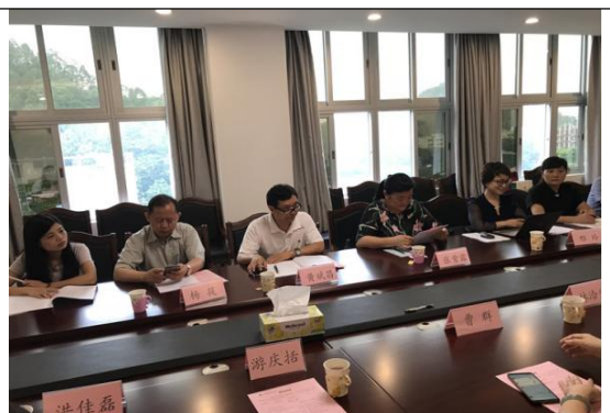
图17：与番禺职业技术学院开展交流