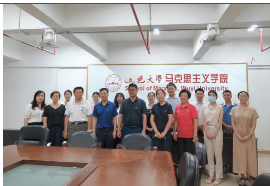
图16：与五邑大学开展交流

在校外，团队连续多年在江门睦州镇开展专题培训，累计覆盖2000人次，广受好评。2024年代表学校参加广东省政策宣贯大赛，作品在学校视频号发布后累计阅读42,917次、转发7,125次、点赞7,217个，形成强大传播效应。成果先后被中国教育电视台、学习强国、南方+、江门日报等主流媒体报道，显著提升了社会影响力与公众认知度，为区域职业教育思政课改革提供了可借鉴、可复制的“南职样本”。