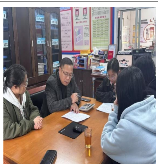
图 4:到社区开展调研