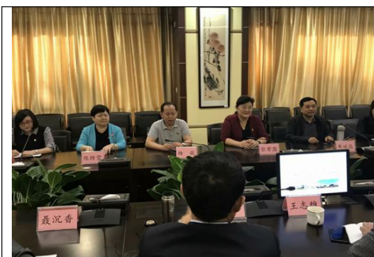
图18: 与顺德职业技术学院开展交流