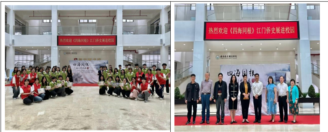
图 12：“四海同根——江门侨史展进校园”