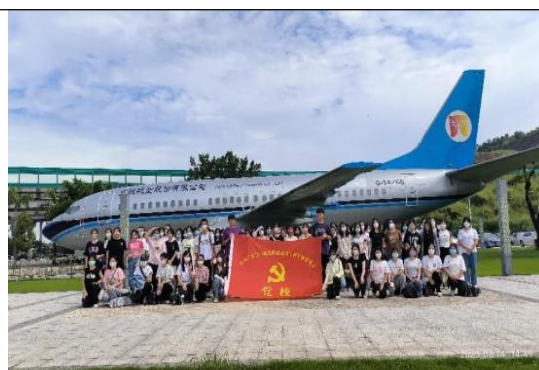
图19: 与江门幼儿示范学院开展交流