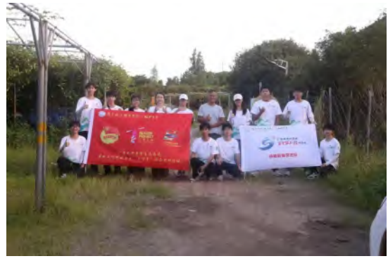
承脉新锋突击队“奋力百千万工程”活动