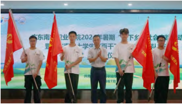
青年突击队暑期“三下乡+奋力百千万”活动