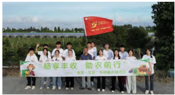
有梦·实践突击队“奋力百千万工程”活动