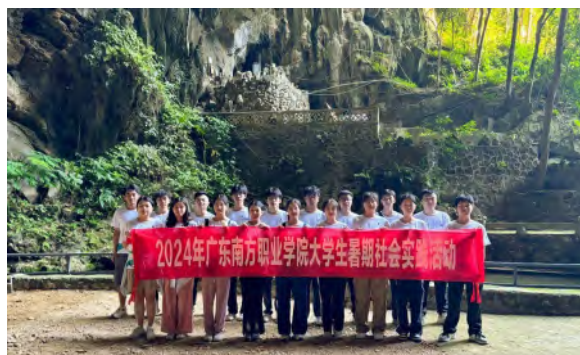
南职向阳青春突击队“三下乡”活动