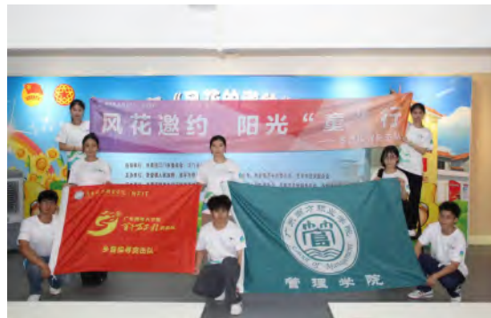
乡音探寻突击队“三下乡”活动