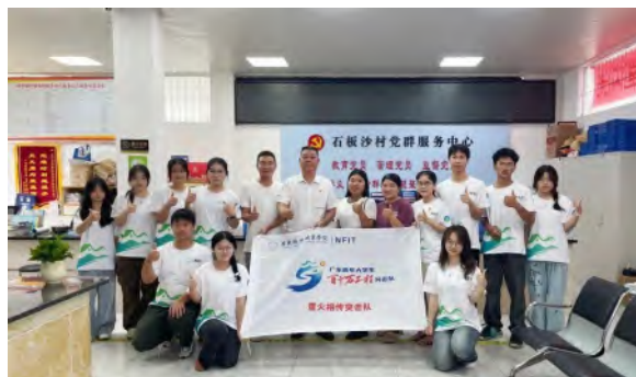
昼火相传突击队“三下乡”活动