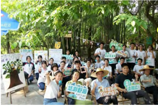
南职青年突击队“奋力百千万工程”活动