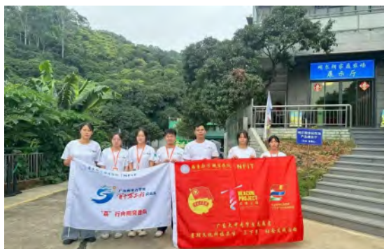
“荔”行向阳突击队“三下乡”活动