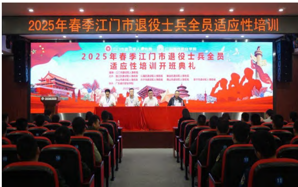
2025年春季江门市退役士兵全员适应性培训在广东南方职业学院开班