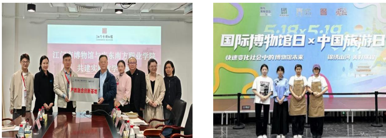
图 4-2 服务地方企业

成果精准匹配侨乡产业新需求，为行业培养输送 5 万名受益学生；与 43 家本地企业共建实训基地，教师团队为侨乡企业提供专业咨询服务，培训退役军人、乡镇基层干部、企业骨干等 8.7 万余人，赋能侨乡产业发展。学生为江门市博物馆、梁启超故居等单位接待海内外华侨超 3 万人次，协助政务接待，获江门市政府、江门市侨联等单位高度认可，助力侨务工作与侨乡文化传播。