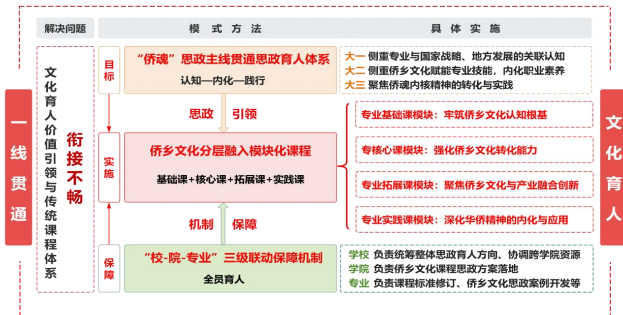
图 2-1 “侨乡文化+课程思政”育人体系